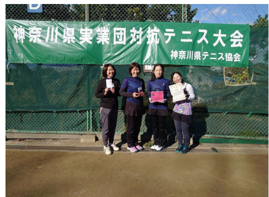
女子準優勝：ソニー厚木（厚木市）