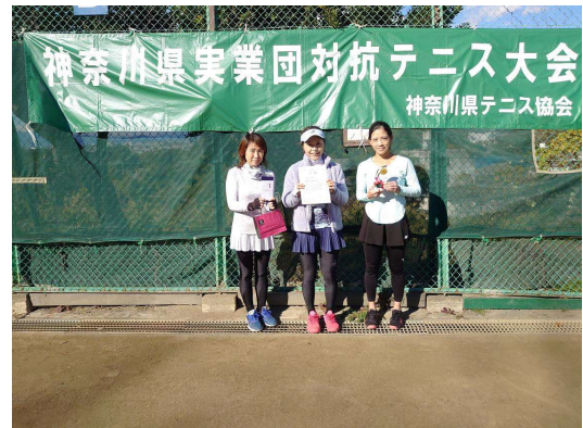
女子優勝：横須賀市役所A（横須賀市）