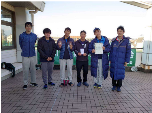
男子第3位：スリーエムジャパンB（相模原市）