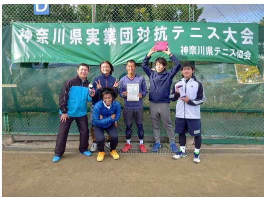
男子準優勝：WDC（藤沢市）