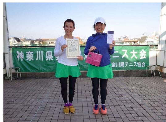
女子第3位：いすゞ自動車（藤沢市）