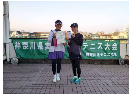
女子第3位：日産テクニカルセンターA（厚木市）