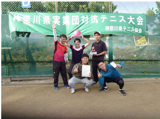
男子優勝：東芝R&Dセンター（川崎市）