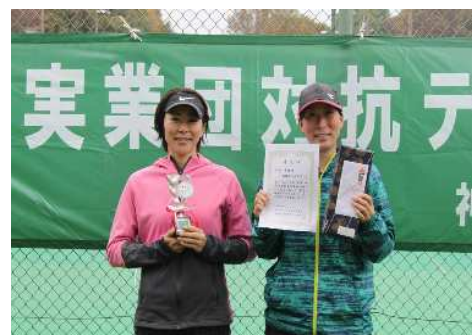
女子準優勝:相模原市教職員(相模原市)