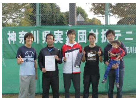
男子3位:東芝京浜(横浜市)