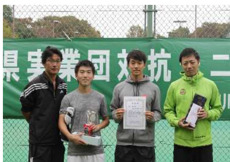
男子準優勝:横須賀市役所(横須賀市)