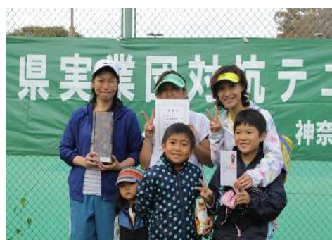
女子3位:北里研究所(相模原市)