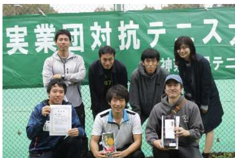
男子優勝:野村総合研究所(横浜市)