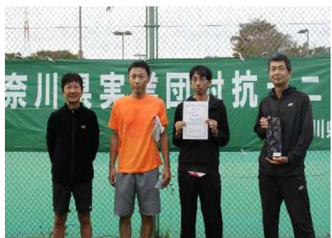
男子3位:神奈川県庁B(横浜市)