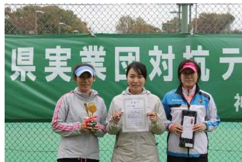
女子優勝:平塚市役所(平塚市)