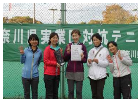
女子3位:神奈川県庁(横浜市)