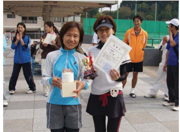
女子準優勝 味の素 (川崎市)