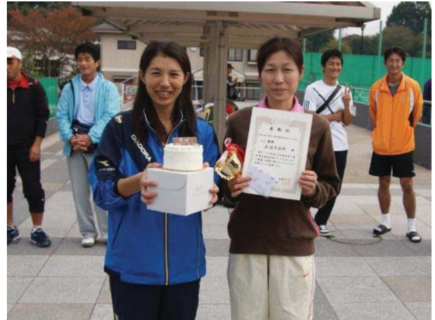
女子優勝 平塚市役所A (平塚市)