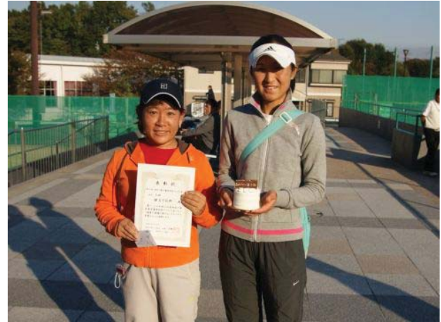
女子三位 鎌倉市役所 (鎌倉市)