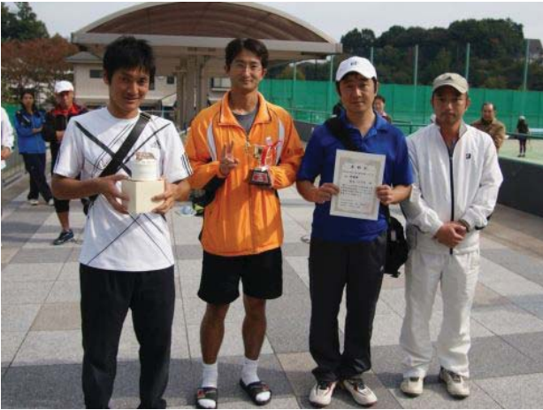
男子準優勝 日立ハイテク (平塚市)