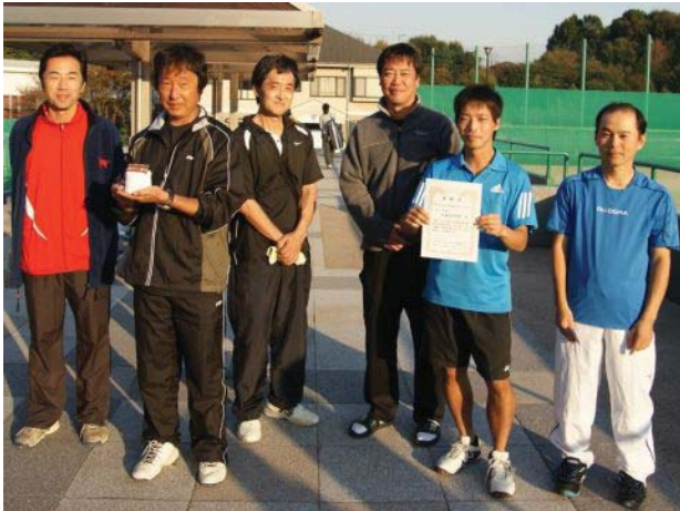
男子三位 大和市役所A (大和市)