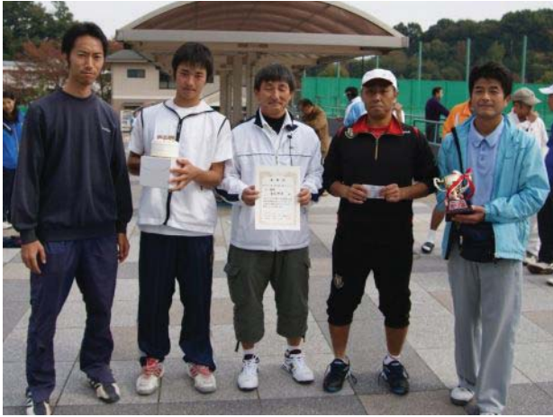
男子優勝 東芝横浜 (横浜市)