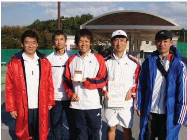
男子三位 日立厚木 (厚木市)