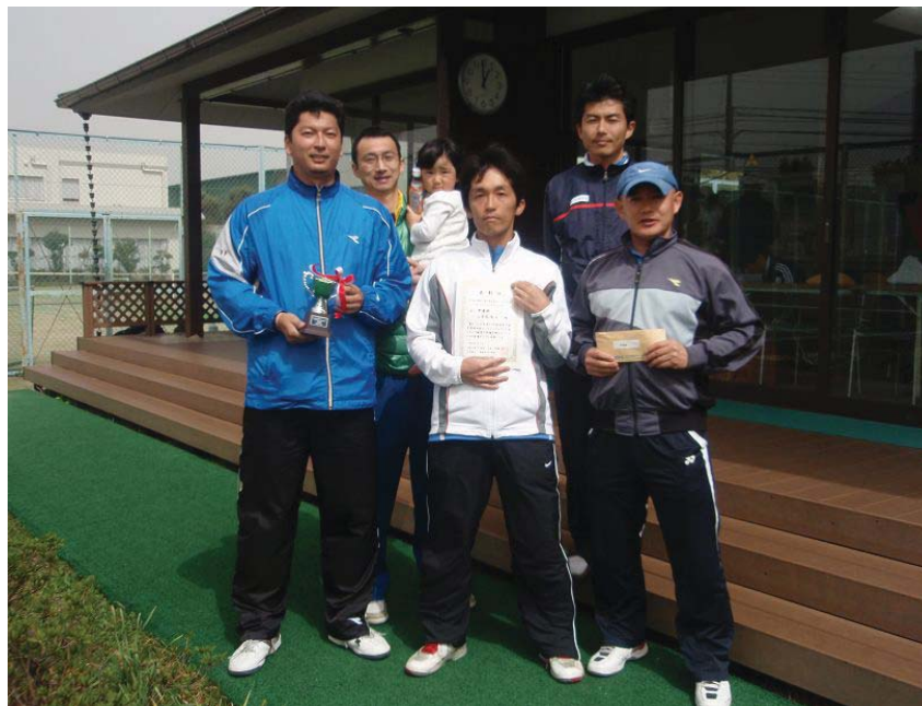
準優勝 三菱電機A (鎌倉市)