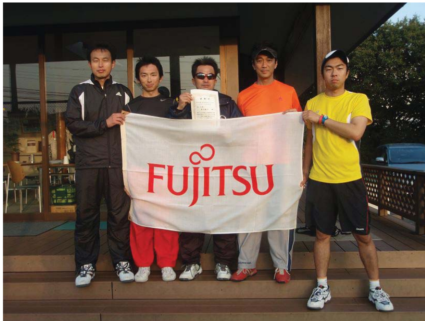
三位 富士通A (川崎市)