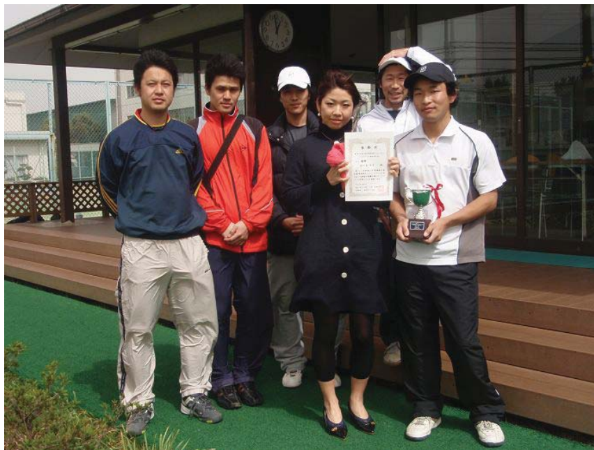
優勝 NEC玉川A (川崎市)